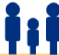
Un ratio d'un entraîneur formé et d'un adulte dont les antécédents ont été vérifiés pour un athlète.