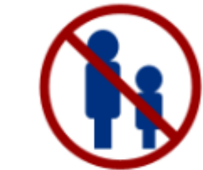
Un ratio d'un entraîneur pour un athlète.

Le but est de s'assurer que toutes les interactions et les communications sont justifiables et se font dans un environnement ouvert et observable.