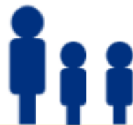
Un ratio d'un entraîneur pour deux athlètes.